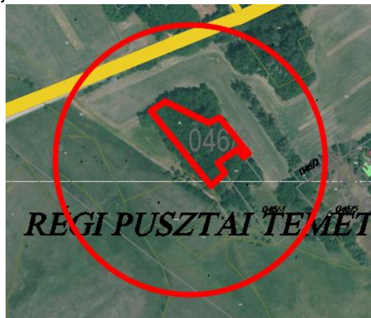
Régi pusztai temető hrsz: 046/8, állami tulajdonú, beerdősült terület.