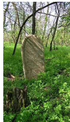
Sírjelek a régi temetőben