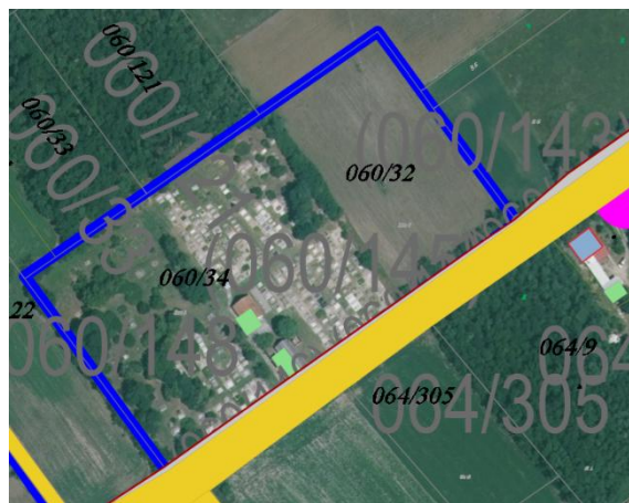
Temető hrsz:060/145 (régí hrsz:060/34), önkormányzati tulajdonú